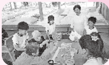
誰が一番取れるかな