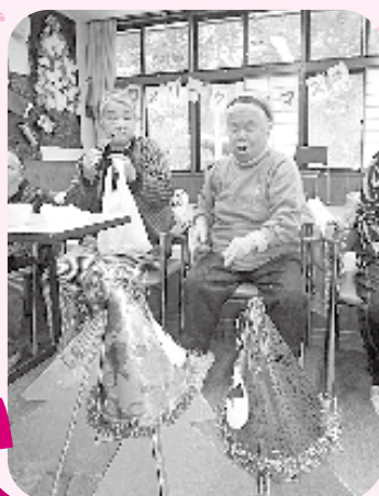
みんなで楽しく過ごせました

12月18・19・20日の3日間、水上デイサービスではクリスマス会を開催し、多くの利用者の皆さんに参加していただきました。 1日目はハーモニカとマンドリンの演奏、2日目はアコーディオンと歌・ダンス、3日目は詩吟と尺八、踊りとバラエティーに富んだ内容となりました。 演奏に合わせて歌ったり踊りを見たりなど、どの日も大変好評で沢山の笑顔がみられました。 これからも利用者の皆さんに楽しんでご利用いただけるよう、季節に合わせた様々な行事を開催したいと思います。