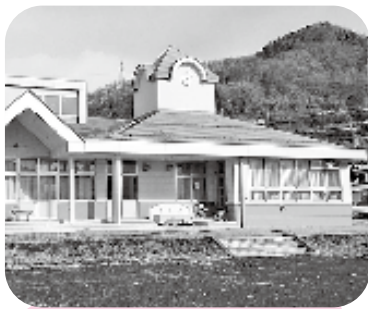
会場の下牧公民館