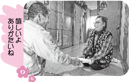
嬉しいよ ありがたいね

民生委員の皆さんにご協力いただき、町内の70歳以上の一人暮らし高齢者699名に、今年は赤飯やおこわ入りのお弁当をお届けしました。「風邪など引かないように、元気に新年を迎えてくださいね」と民生委員さんが声を掛けながら手渡すと、「ありがとうございます！と笑顔で受け取っていました。