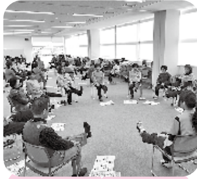
体を伸ばして介護予防

内田病院より3名の講師をお招きし、「福老ソング体操（前半）」の指導をしていただきました。介護予防活動を行うための知識や技術を身につけるため、メモをとりながら実施指導を真剣に取り組んでいました。