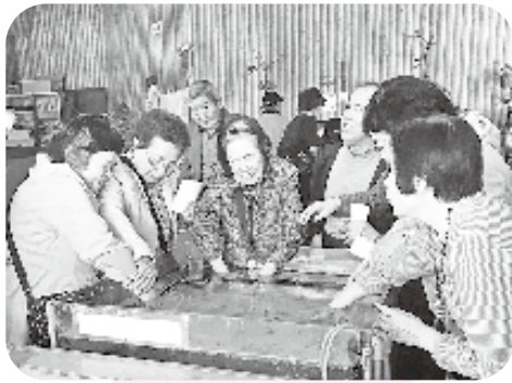
独特な感触だね ドクターフィッシュ

「草津よいとこ」1度はおいでよ」と湯もみ歌でよく知られる草津温泉へ会員、ボランティアを含め総勢14名で行ってきました。 足湯につかりホッと一息つきながら眺めた湯畑は、紫色にライトアップされ真冬の夜空に流れるオーロラのようなものでした。翌日は湯畑周辺でのお買い物、お食事など思い思いに過ごした後、草津熱帯園を見学してきました。恐る恐る水槽に手を入れ、皆さん初めてのドクターフィッシュを体験したり、ふわふわのヒヨコとのふれあい癒されていました。園内はともかく、皆さんいい運動になったようです。