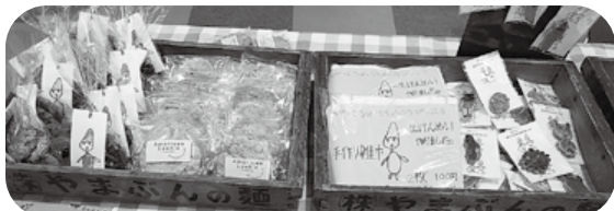
みんなで作りました