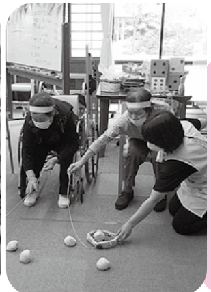
暑さも吹き飛ばす戦いです