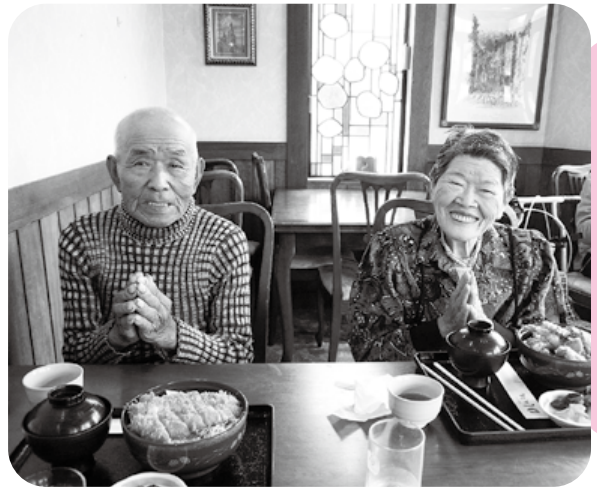
自分好みのメニューを選んで

新緑が美しくなってきた5月。昨年に引き続き外食イベントを今年も開催しました。「なかなか外食できないからうれしい」と喜ばれている方もいらっしゃいました。仲の良い方々との食事では会話も弾み、普段よりもたくさん食べられました。また機会があれば外食に出掛けたいと考えています。