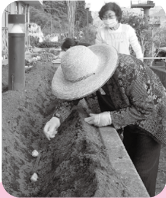
美味しい野菜が取れますように

6月には暑い夏を少しでも涼しく感じられるよう風鈴作りを行いました。色とりどりで個性的な風鈴が出来上がりました。風鈴の音を聞くと、とても幸せな気持ちになります。