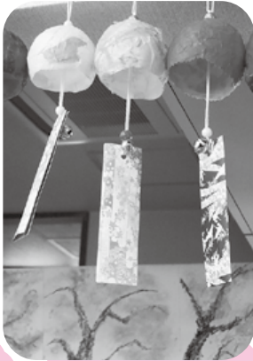
風鈴を見て涼しく