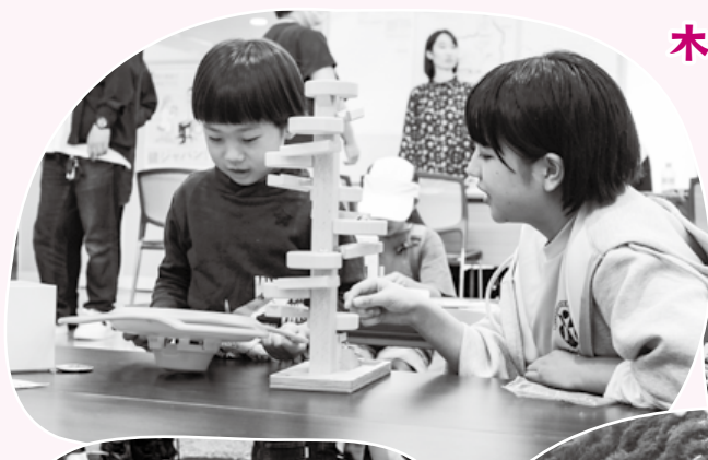
木を使ってみんなで遊ぼう