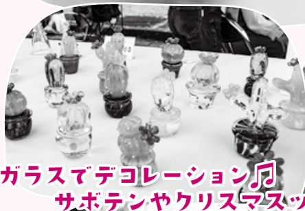
ガラスでデコレーション サボテンやクリスマスツリー