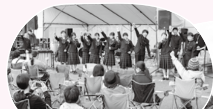
みなかみ中吹奏楽部のみなさん