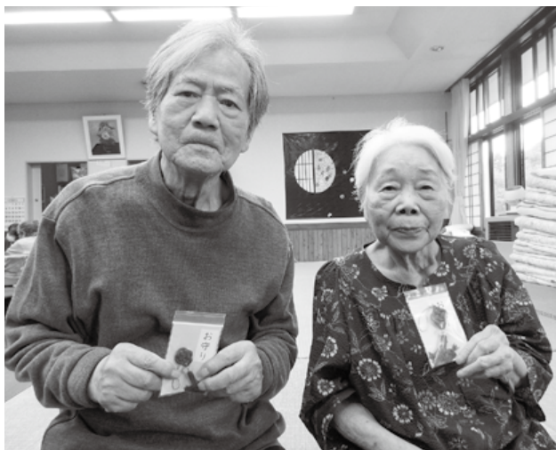
明るく元気で健康な毎日へ