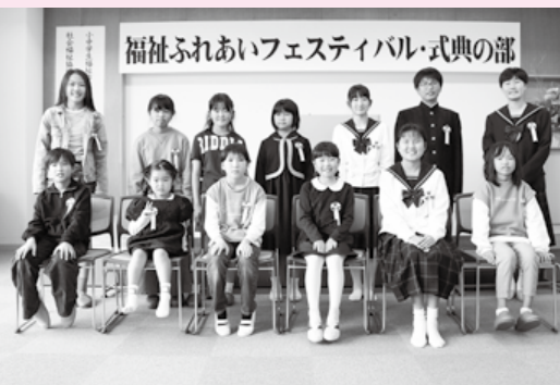
福祉作文の部 受賞者の皆さん