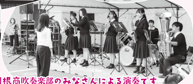
利根高吹奏楽部のみなさんによる演奏です