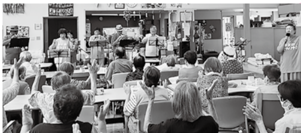
楽しくステキな演奏

笑顔オカリナ「たくみ」の皆さん、素敵な演奏ありがとうございました。是非とも、また演奏していただけると幸いです。