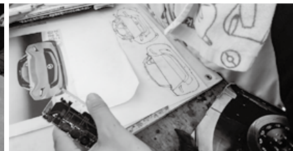
自由に表現します