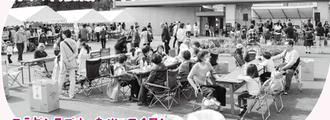
フラダンスでゆったりハワイアン